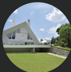
サビエル記念聖堂